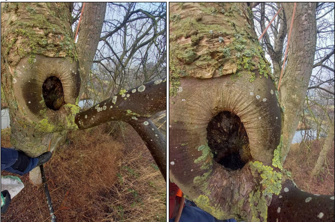
Figuur 4. Bevindingen bij de controle van de holte. De holte betreft een rotting van circa 10 centimeter diepte die vanaf de opening naar beneden loopt.