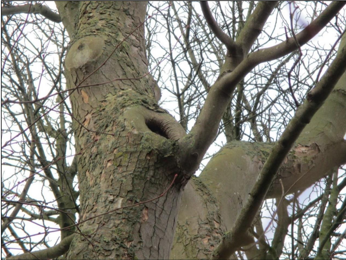
Figuur 3. Onderzochte boomholte.