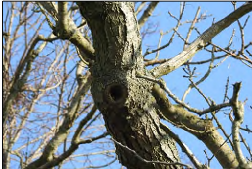
Afbeelding 2.7. Ongeschikte en niet doorgerotte holte.

Tijdens het veldbezoek zijn geen potentieel geschikte holten voor vleermuizen aangetroffen. De onderzochte locaties bestonden vooral uit jonge loofbomen. In de oudere loofbomen zijn wel beginselen van holten aangetroffen, echter zijn deze nog niet doorgerot of uitgehakt (afbeelding 2.7.). Daarbij hadden enkele dode bomen loslatende en gescheurde schors. De schors zat zowel aan de onderzijde als bovenzijde los, deze locaties zijn niet waterdicht en ongeschikt als verblijfplaats voor vleermuizen. De bomen met scheuren beschermen niet tegen de weersomstandigheden. Dergelijke locaties zijn ongeschikt als verblijfplaats voor vleermuizen (afbeelding 2.8.).