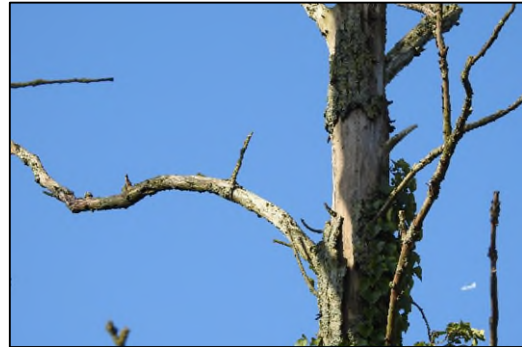
Afbeelding 2.8. Niet waterdichte locaties met loszittende schor aan bovenzijde.