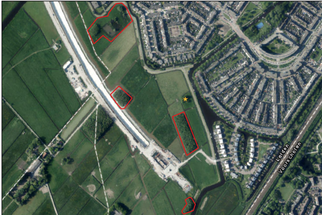
Afbeelding 2.1. Potentieel jaarrond beschermd nest van buizerd (gele ster) te midden van de vier meest zuidelijke bosschages.

Bij handhaving van het huidige tracé-ontwerp, zijn er geen werkzaamheden binnen de verstoringsafstand van 75 vanaf het nest te verwachten. In dat geval zijn vervolgacties niet noodzakelijk.