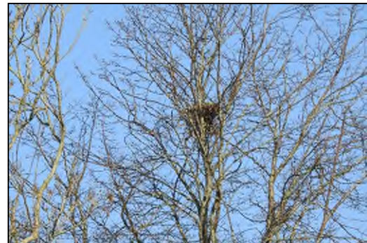
Afbeelding 2.3. Potentieel jaarrond beschermd nest.