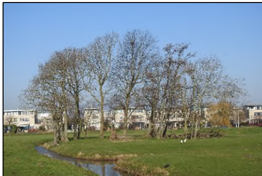
Afbeelding 2.2. Ligging potentieel jaarrond beschermd nest.