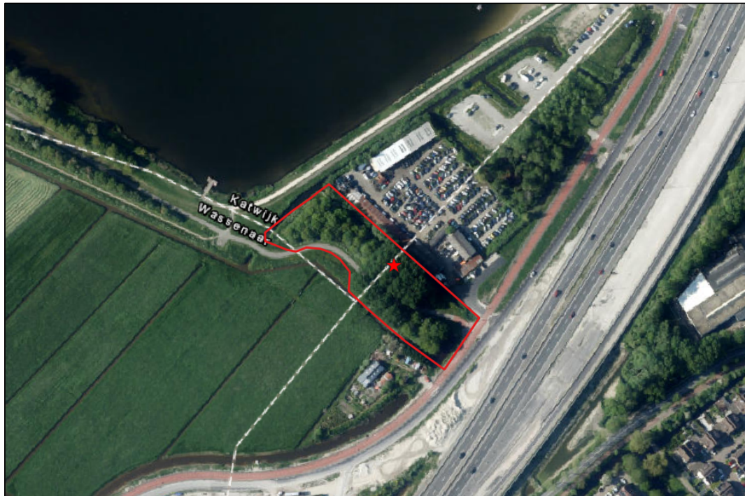
Afbeelding 2.4. Potentieel jaarrond beschermd nest van ransuil (rode ster) in de meest noordelijke bosschage.