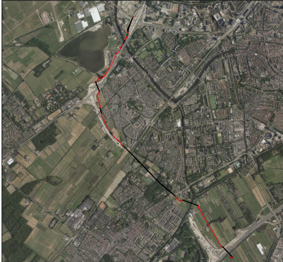
Figuur 1.1: Ligging tracé met aanleg in open ontgraving (rood) en met sleufloze technieken (zwart).

In opdracht van LdM C.V. is door Antea Group aanvullend ecologisch onderzoek uitgevoerd in het kader van de aanleg van een warmtenet. Het warmtenet bestaat uit twee parallelle leidingen, namelijk een aanvoerleiding en een retourleiding. De leidingen betreffen stalen buisleidingen DN500 met rondom een isolatielaag. Het tracé is in figuur 1.1 weergegeven.