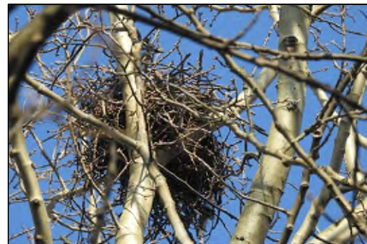
Afbeelding 2.6. Potentieel jaarrond beschermd nest ransuil