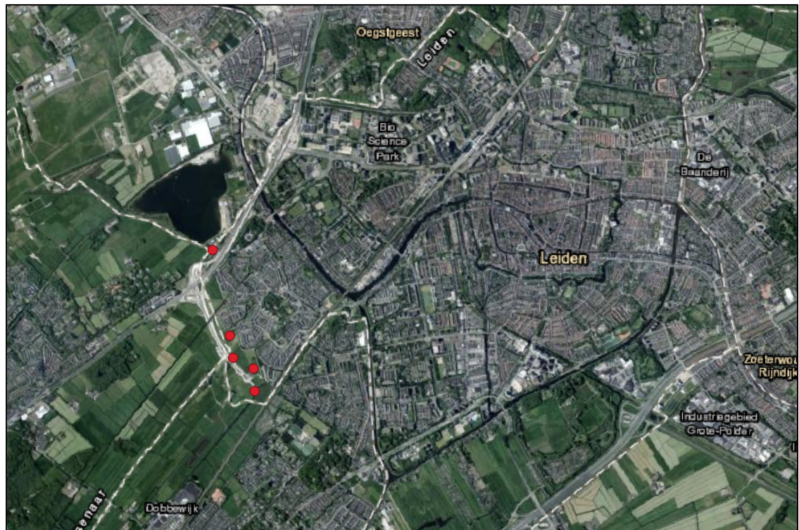
Figuur 1.2: Globale ligging van de onderzochte bosschages (rode stippen).

De vier meest zuidelijke projectgebieden liggen ten westen van de wijk Dobbewijk te Leiden. Deze projectgebieden liggen in het agrarisch landschap met weiden, grenzend aan een woonwijk. De bosschages bestaan uit jonge elzenopslag met een ondergroei van braamstruweel. Te midden van de projectgebieden staan enkele hoge oude loofbomen.