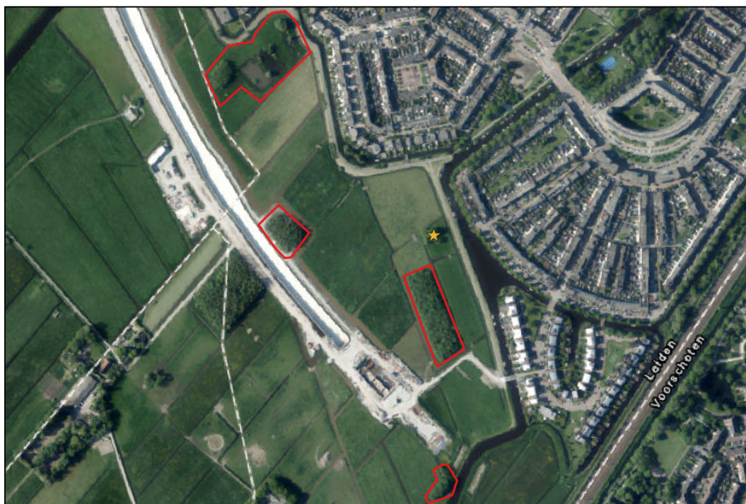
Afbeelding 2.1. Potentieel jaarrond beschermd nest van buizerd (gele ster) te midden van de vier meest zuidelijke bosschages nabij het Liesbeth Ribbiuspad.

Om te bevestigen dan wel uit te sluiten dat dit nest in gebruik is, en om te onderzoeken door welke soort, dient er nader onderzoek uitgevoerd te worden naar de buizerd en de ransuil. Een dergelijk nader onderzoek kan bestaan uit het uitvoeren van vier veldbezoeken in de periode maart tot en met 15 mei waarbij er minimaal 10 dagen tussen de veldbezoeken dienen te zitten en minimaal één bezoek in mei plaatsvindt. Het veldbezoek dient plaats te vinden in de ochtend, van een uur vóór zonsopkomst tot een uur na zonsopkomst. In totaal zal één veldbezoek dus maximaal twee uur duren. Indien een broedgeval met zekerheid wordt vastgesteld, zijn aanvullende veldbezoeken niet noodzakelijk. De locaties van de te onderzoeken nesten zijn weergegeven in figuur 2.1 en 2.4.