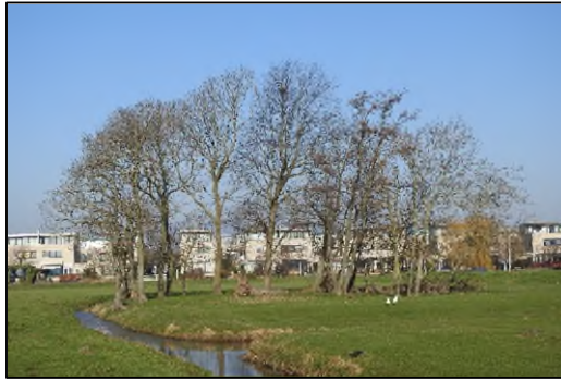
Afbeelding 2.2. Potentieel jaarrond beschermd buizerdnest

Potentieel jaarrond beschermde nesten tracé WarmtelinQ Rijswijk-Leiden lot F projectnummer 0475588.100 30 mei 2023 revisie 00 LdM C.V. (WarmtelinQ)