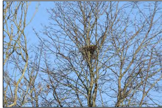
Afbeelding 2.3. Potentieel jaarrond beschermd buizerdnest.