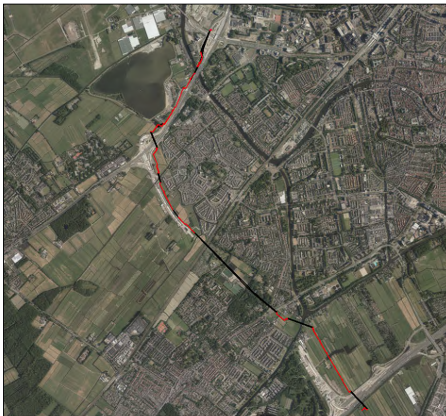
Figuur 1.2: Ligging tracé met aanleg in open ontgraving (rood) en met sleufloze technieken (zwart).

De regionale ligging van het tracé is in figuur 1.2 weergegeven.